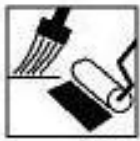
Fırça ve Rulo ile uygulanmaz.